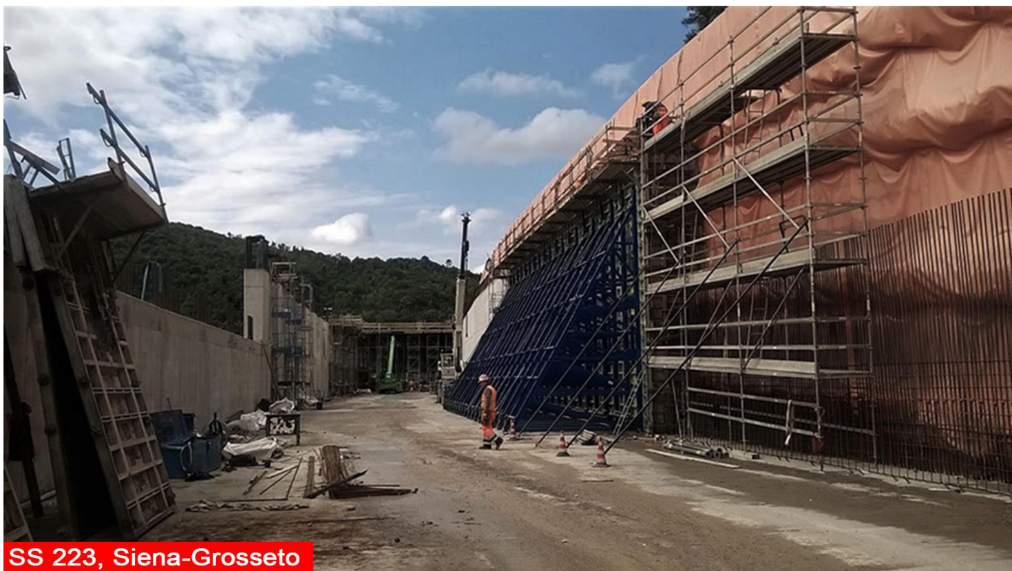
SS 223, Siena-Grosseto