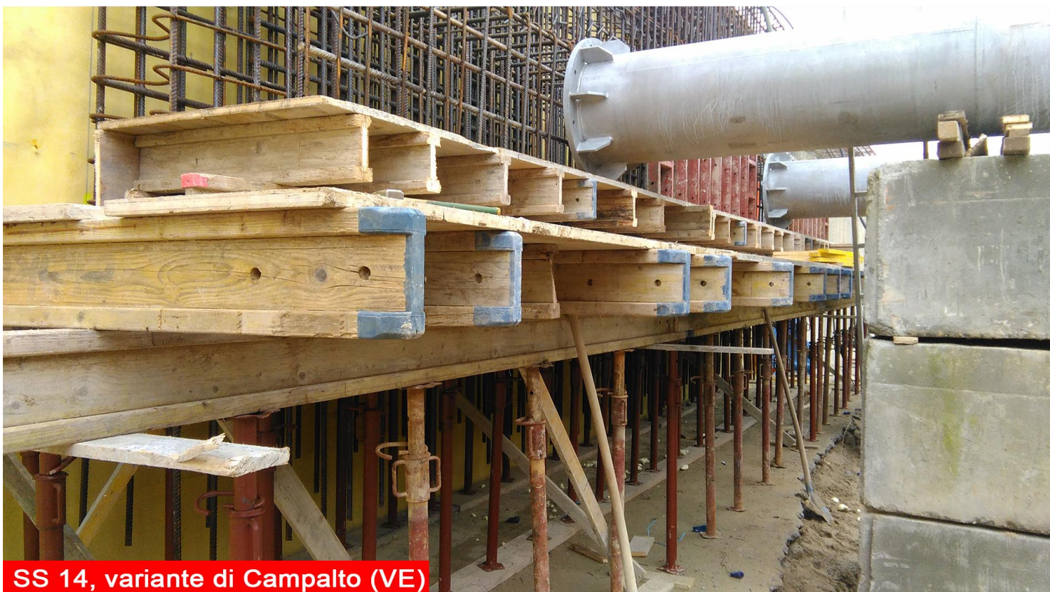
SS 14, variante di Campalto (VE)