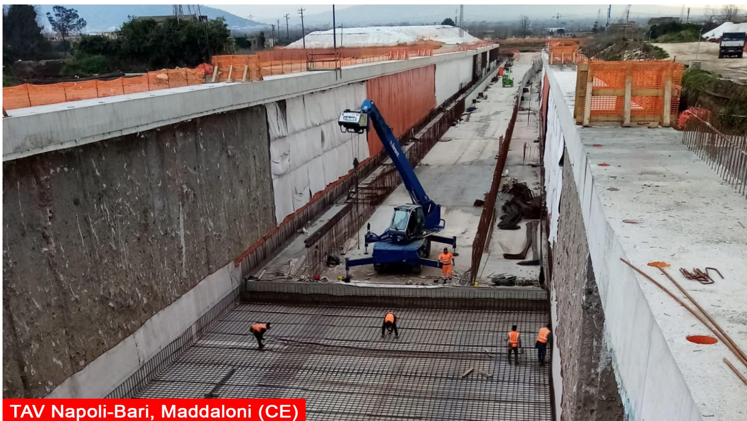
TAV Napoli-Bari, Maddaloni (CE)