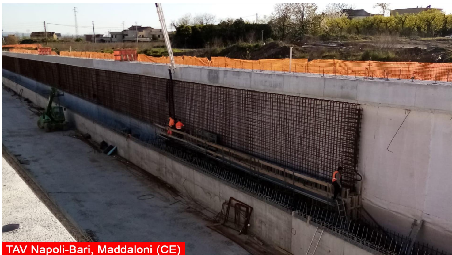
TAV Napoli-Bari, Maddaloni (CE)