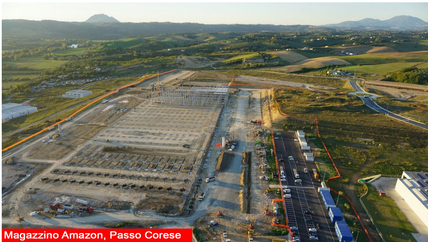
Magazzino Amazon, Passo Corese