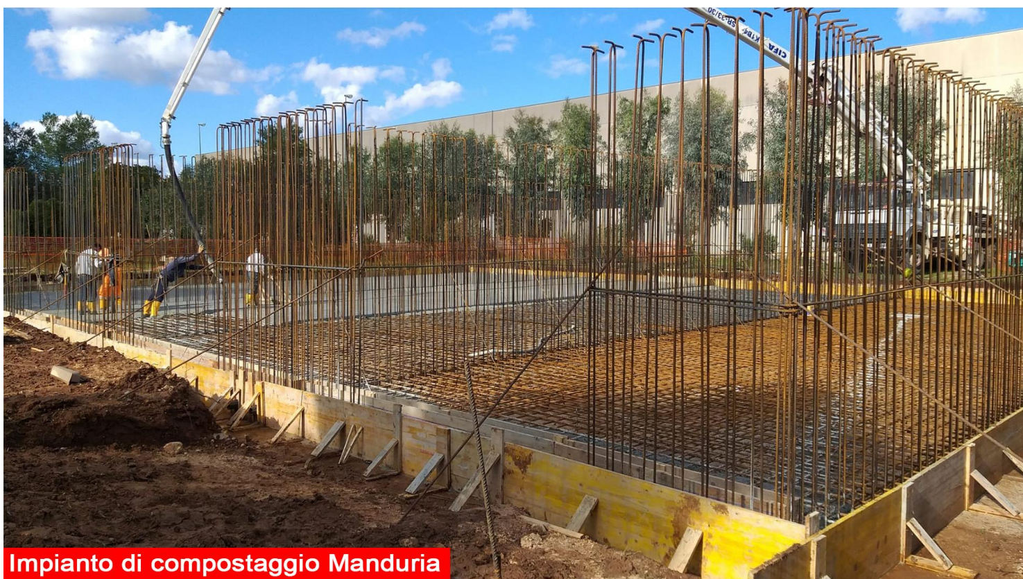
Impianto di compostaggio Manduria