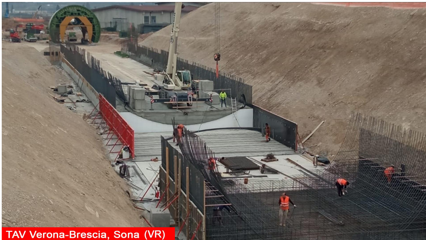
TAV Verona-Brescia, Sona (VR)