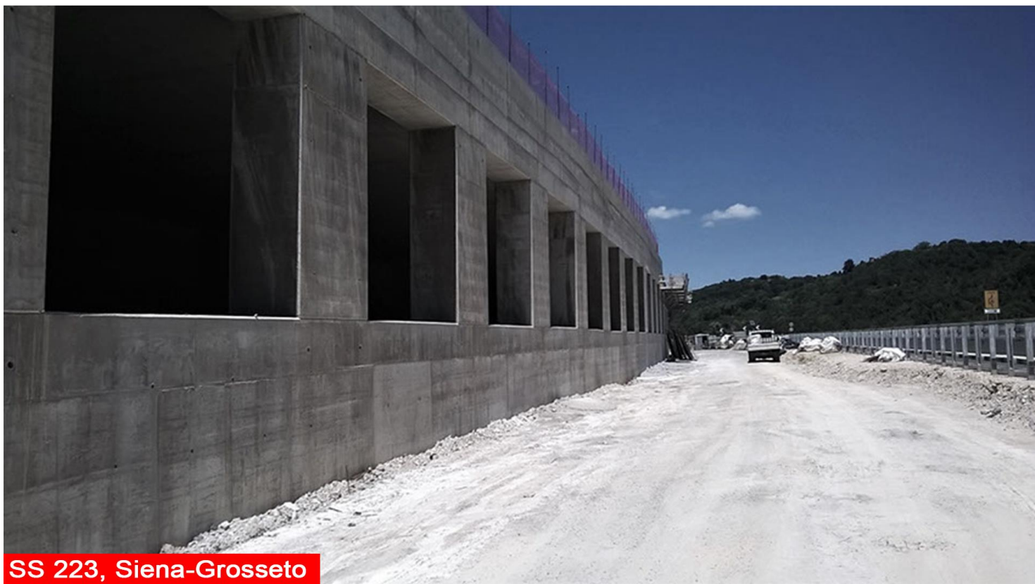
SS 223, Siena-Grosseto