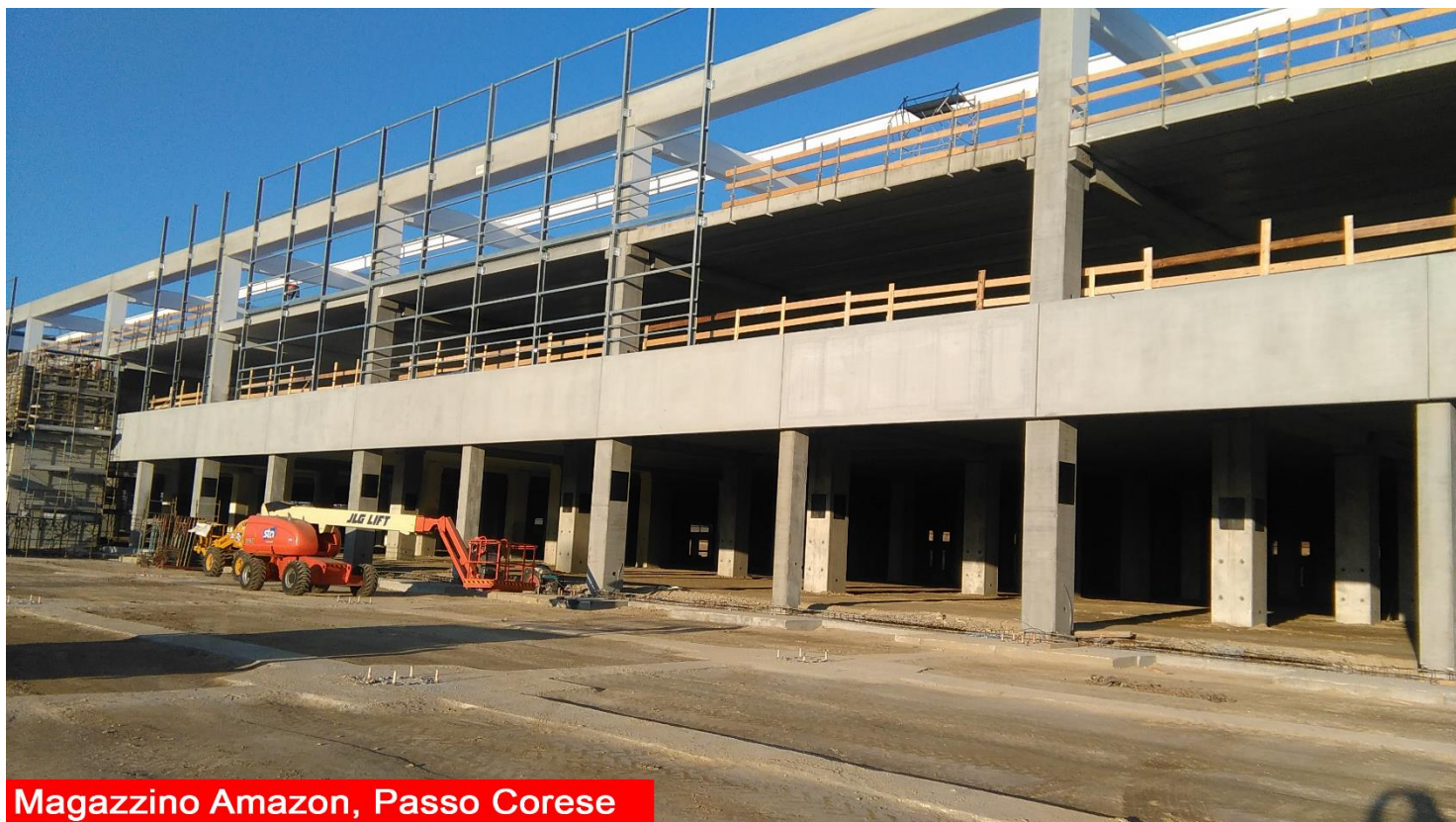
Magazzino Amazon, Passo Corese