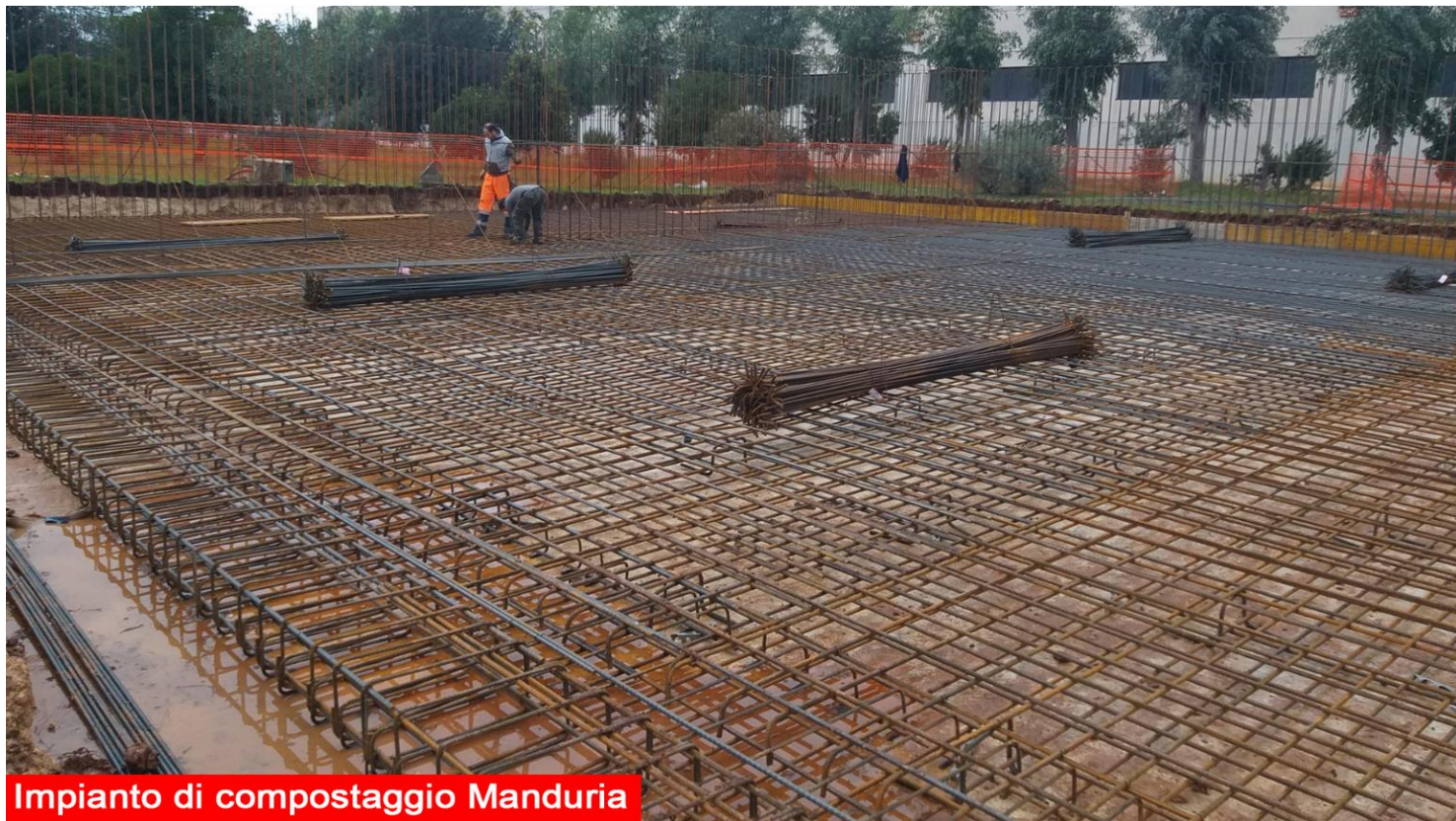
Impianto di compostaggio Manduria