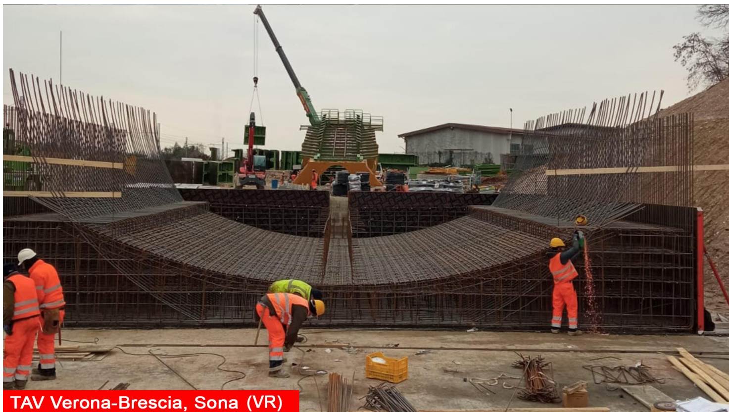
TAV Verona-Brescia, Sona (VR)